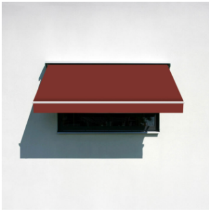
♡ Favorit MARKISVÄV 84

Styrelsen föreslår att stämman ska besluta om de färger som får användas vid nyinstallation av markiser. Styrelsen föreslår att endast tre specifika färger godkänns för installation av markiser, för att säkerställa en enhetlig och estetiskt tilltalande fasad. De godkända färgerna är [84, 1400/712 och 986/15]. Medlemmarna ansvarar för att välja och installera markiser i enlighet med dessa färgkrav och står själva för alla kostnader som uppstår vid installationen, inklusive inköp och arbetskostnader.