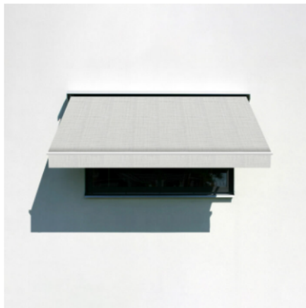
♡ Favorit MARKISVÄV 986/15